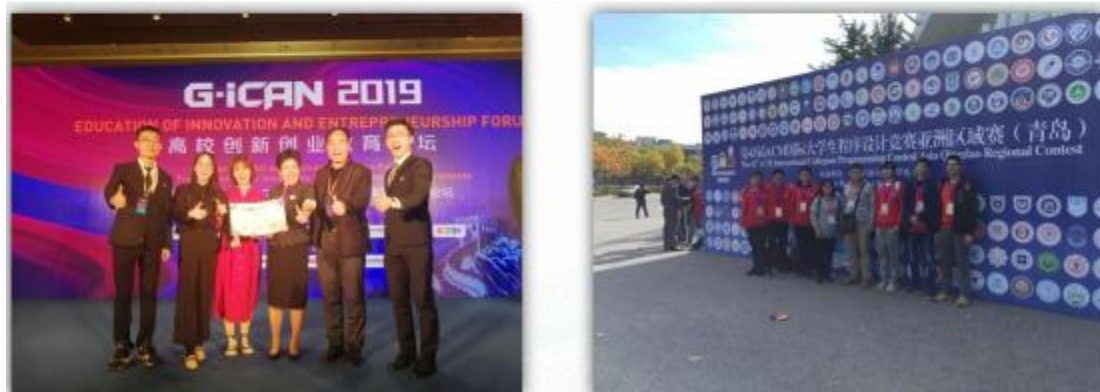
郑州大学学生团队荣获iCAN原创中国精英赛特等奖