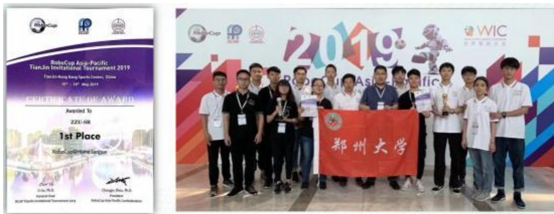
郑州大学机器人团队获得2019亚太机器人世界杯天津邀请赛服务机器人家庭组冠军！ NAO足球机器人亚军