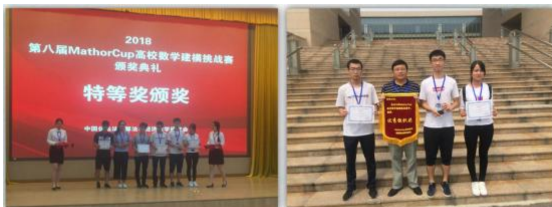
郑州大学学生团队荣获第八届MATHORCUP高校数学建模挑战赛特等奖