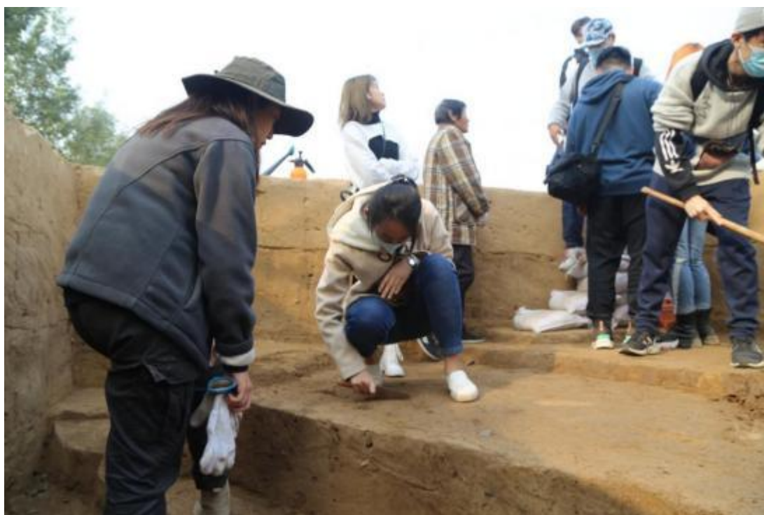
港澳台生参观官庄考古现场