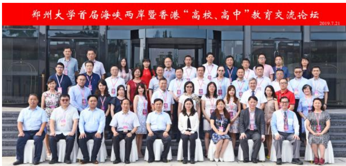
郑州大学首届海峡两岸暨香港“高校、高中”教育交流论坛与会师生合影。