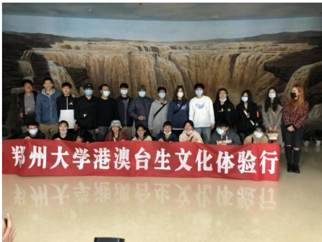
港澳台生游览黄河博物馆