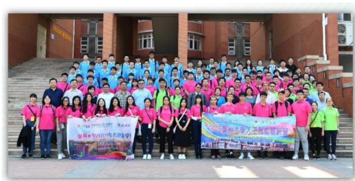
2019年香港游学营第二期开营仪式