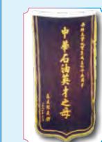
中华石油英才之母