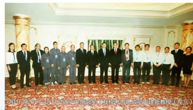
2016 年 6 月 22 日习近平主席会见了我校考古队成员王建新教授（左三）

设有 88 个本科专业，其中 37 个专业入选“国家级一流本科专业”建设点，17 个专业入选“省级一流本科专业”建设点。有 3 个教育部基础学科拔尖学生培养计划 2.0 基地，7 个国家级人才培养基地并设有国家大学生文化素质教育基地，紧紧围绕高质量发展主题，学校抓住人才培养质量为核心，形成了以国家基础学科拔尖学生培养基地为龙头、一流专业为重点的专业体系，相互支撑、协调发展，构建了基础拔尖和卓越创新等多元人才培养模式。