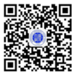
西北大学招生办公室