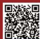
浙江大学本科招生 云服务平台