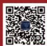
浙江大学本科招生 微信公众号