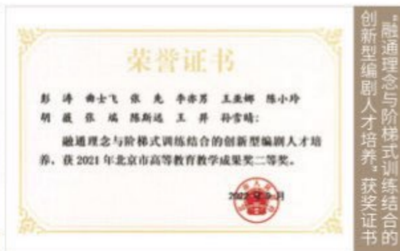
融通理念与阶梯式训练结合的 创新型编剧人才培养，获奖证书