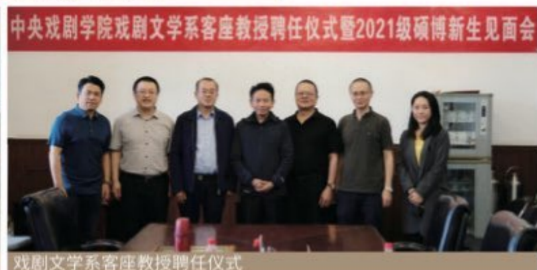
中央戏剧学院戏剧文学系客座教授聘任仪式暨2021级硕博新生见面会