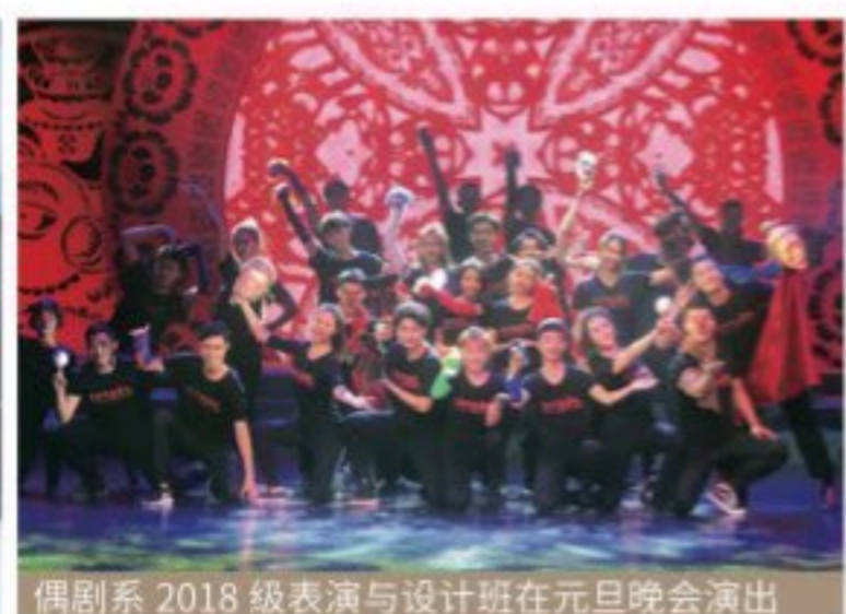
偶剧系 2018 级表演与设计班在元旦晚会演出