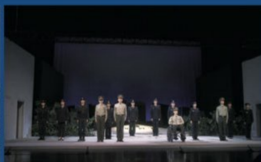
戏剧教育系禁毒大戏《天晴了》