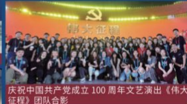
庆祝中国共产党成立100周年文艺演出《伟大征程》团队合影