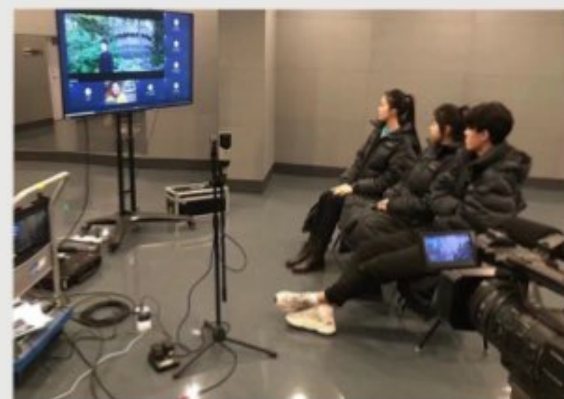
2020年中华文化知识大赛