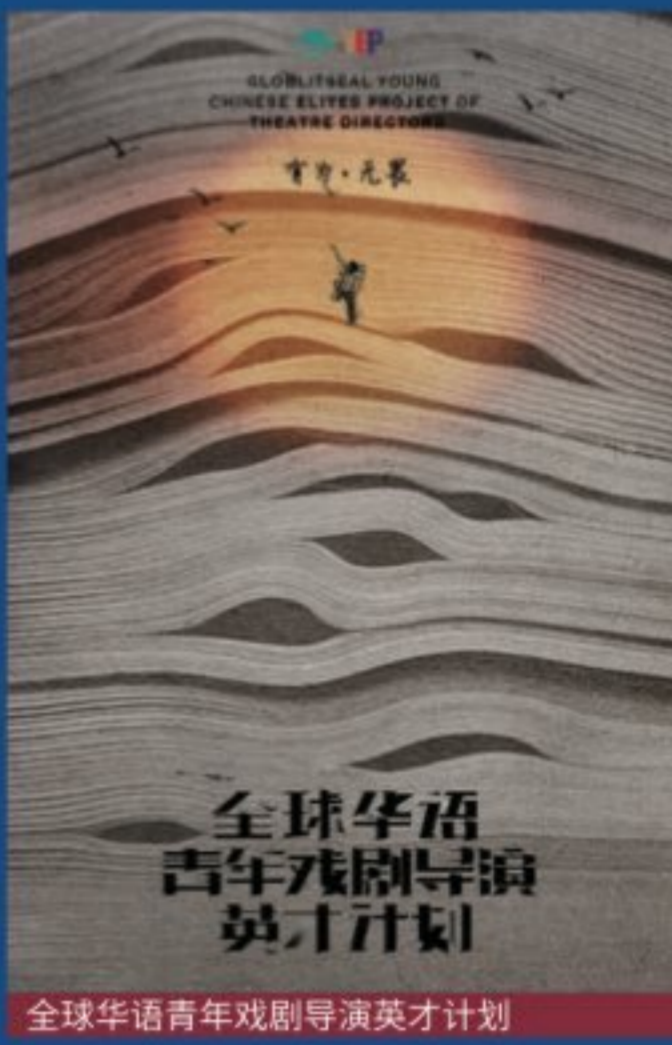
全球华语青年戏剧导演英才计划