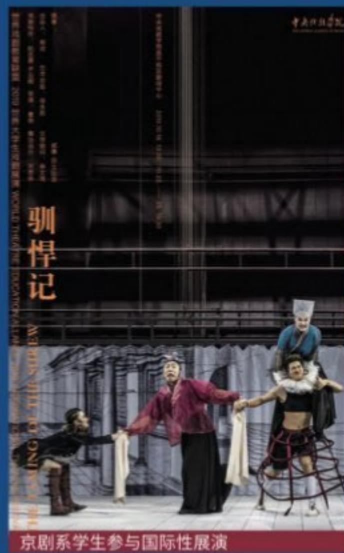
京剧系学生参与国际性展演

京剧系设有表演专业（京剧表演、京剧音乐伴奏方向），培养系统掌握京剧舞台表演技能、创作方法与基础理论，从事京剧表演、演奏、教学及研究的专门人才。