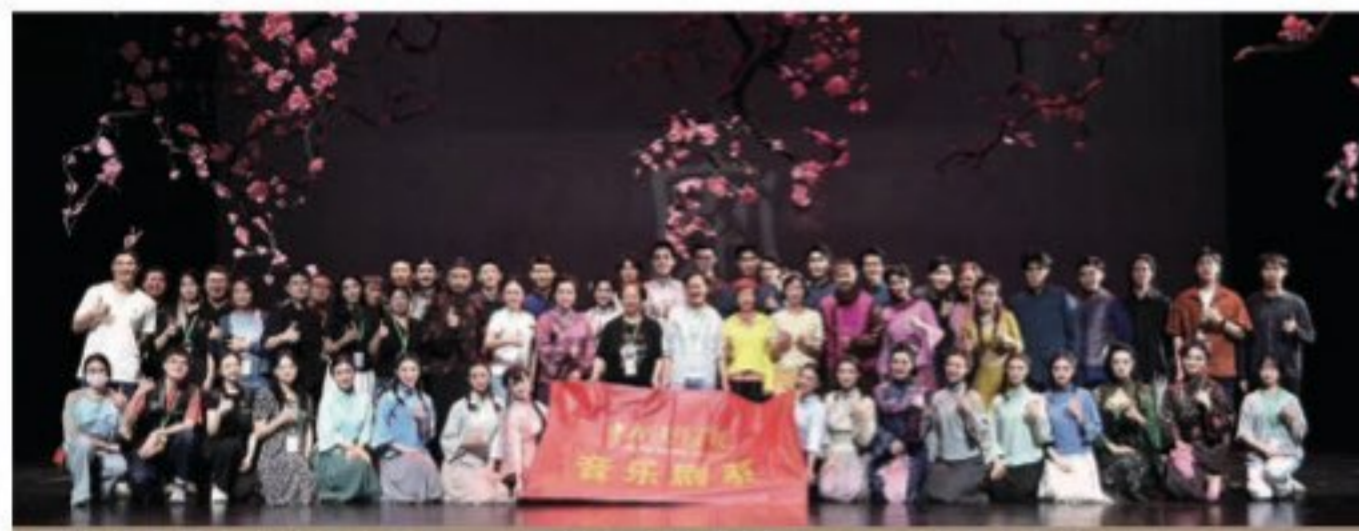
国家艺术基金交流推广项目——原创音乐剧《家》2023年巡演上海站

音乐剧系设有音乐剧专业，培养具有全面文化艺术素养，系统地掌握表演艺术创作方法、基本技能和基本理论，音乐、舞蹈基本功扎实，能够运用音乐剧表演创作技巧从事音乐剧表演创作实践的专门人才。