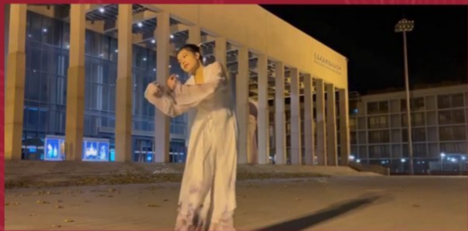
2021年中华文化知识大赛