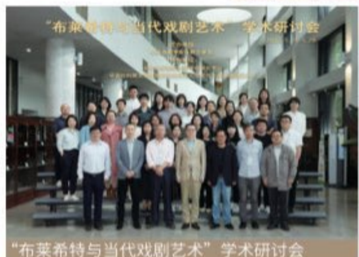
“布莱希特与当代戏剧艺术”学术研讨会