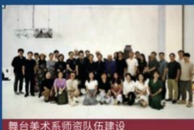
舞台美术系师资队伍建设