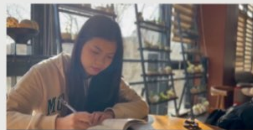
2021年中华文化知识大赛