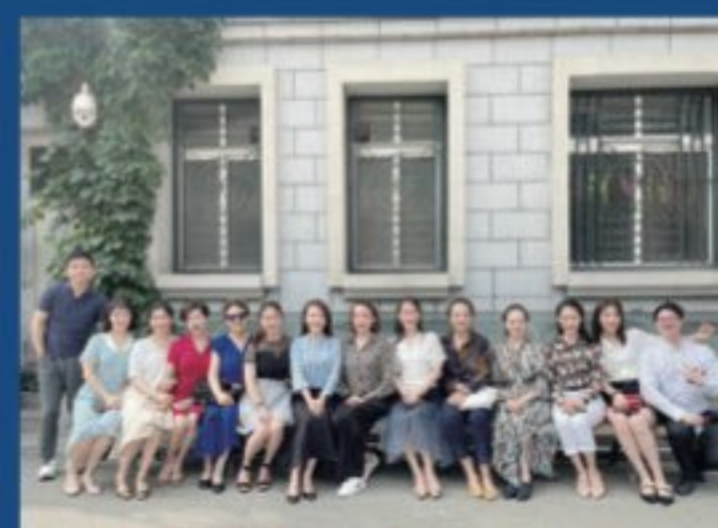
戏剧教育系师资队伍建设

戏剧教育系设有戏剧教育专业，培养具有较高文化艺术修养，基本掌握戏剧创作理论与技能，能够从事大中小学戏剧教育工作并具备组织演剧活动潜质的复合型人才。