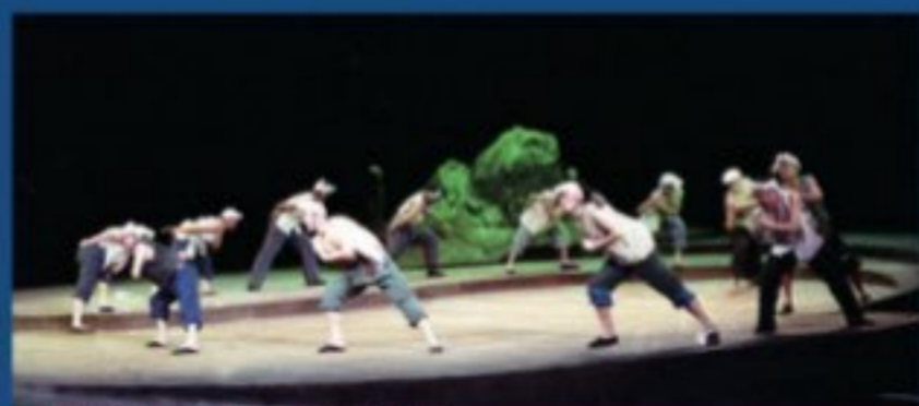
《桑树坪纪事》(徐晓钟) 表演系 1986 级干部进修班演出

导演系设有戏剧影视导演专业(戏剧导演方向),培养掌握导演创作规律、具备从事戏剧、影视导演创作实践能力的专门人才。