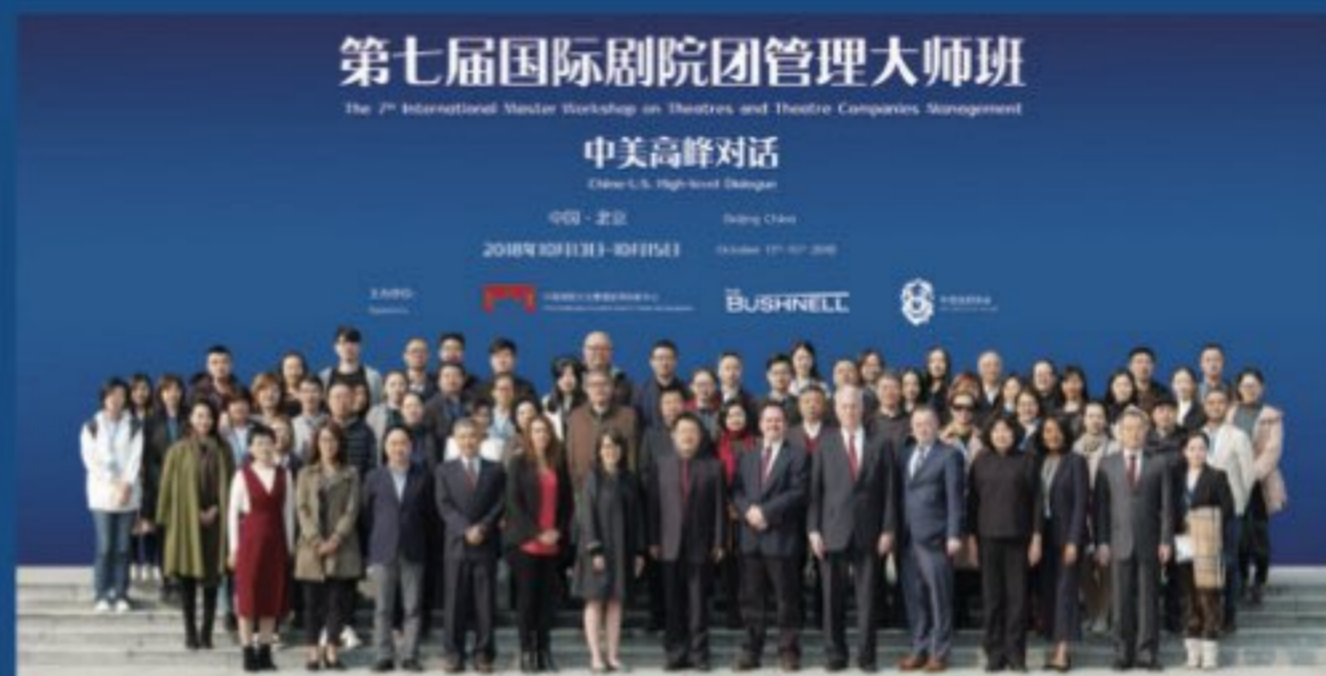
“第七届国际剧院团管理大师班——中美高峰对话”嘉宾合影

戏剧管理系设有艺术管理专业（演出制作方向、剧院管理方向），演出制作方向培养文化市场迫切需求的演出策划、戏剧制作及运营方面的高层次管理人才；剧院管理方向主要培养剧院、剧团和剧场的专业管理人才。