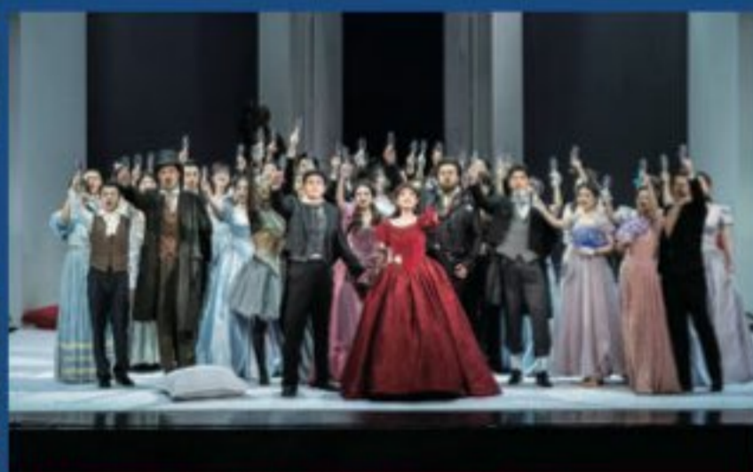
2018 级歌剧表演班毕业大戏《茶花女》