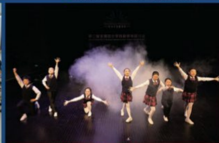
第二届全国中小学戏剧教育研讨会