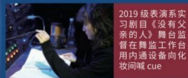
2019级表演系实习剧目《没有父亲的人》舞台监督在舞监工作台用内通设备向化妆间喊cue