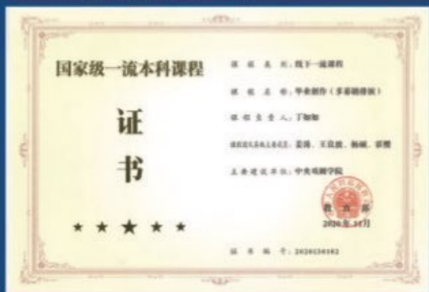
毕业创作(多幕剧排演)(课程负责人:丁如如,团队成员:姜涛、王良波、杨硕、霍樱),获国家级一流本科课程(线下一流课程)(2020 年 11 月)