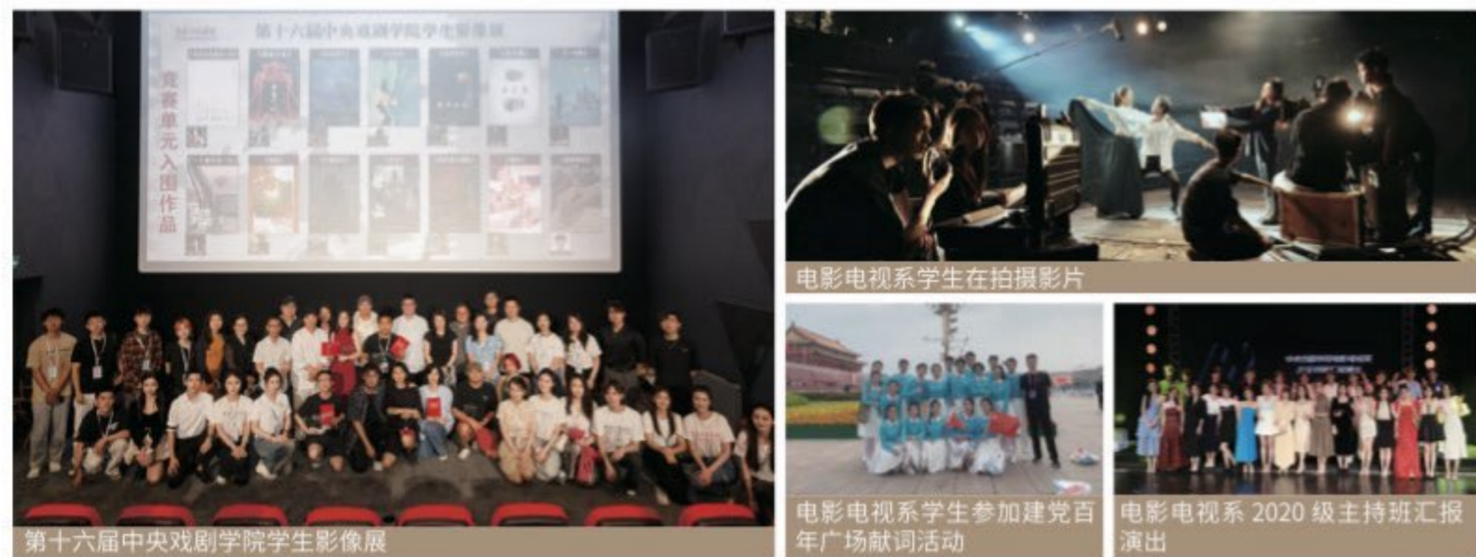
第十六届中央戏剧学院学生影像展

电影电视系设有戏剧影视导演专业（电影导演方向）、艺术管理专业（影视制片方向）、播音与主持艺术专业（广播电视节目主持方向）、录音艺术（电影声音设计与制作方向），培养电影艺术创作人才；文化艺术事业特别是电影电视专业管理、运营人才；各类媒体主持艺术人才。