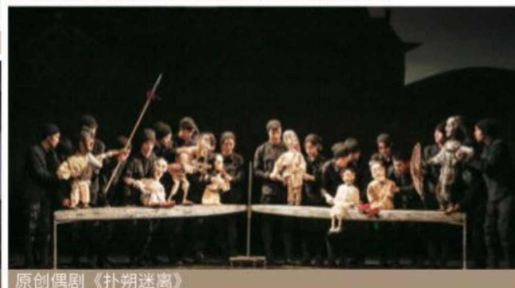
原创偶剧《扑朔迷离》