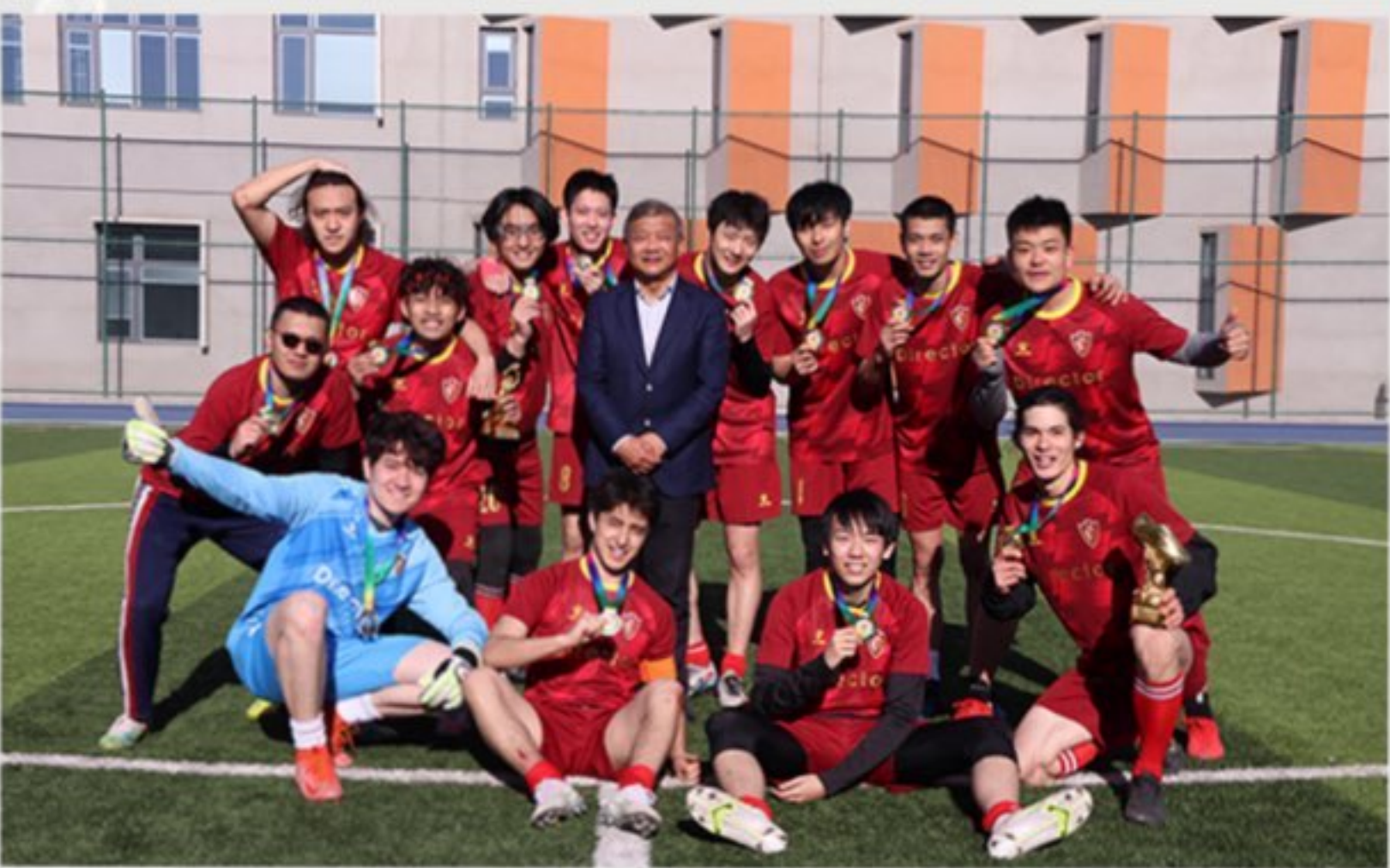
代表系部夺得校园足球赛冠军