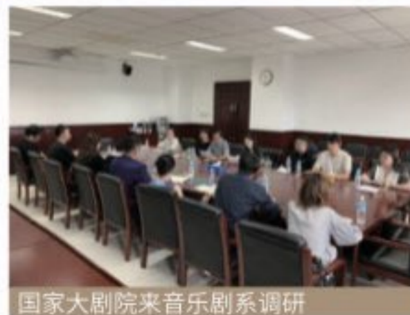
国家大剧院来音乐剧系调研