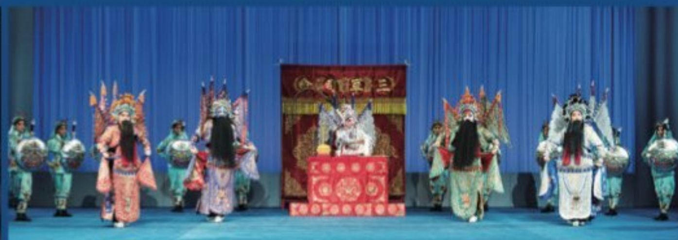
国际形体语言表演大赛“剧目优秀表现奖”、第九届中国京剧艺术节展演剧目、国戏杯金奖剧目《魂断巴丘》