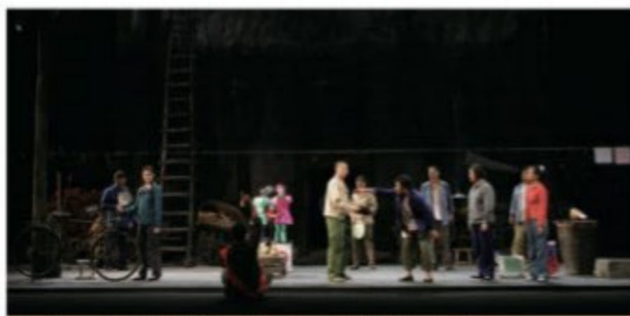
表演系青年教师培养项目《红白喜事》剧照