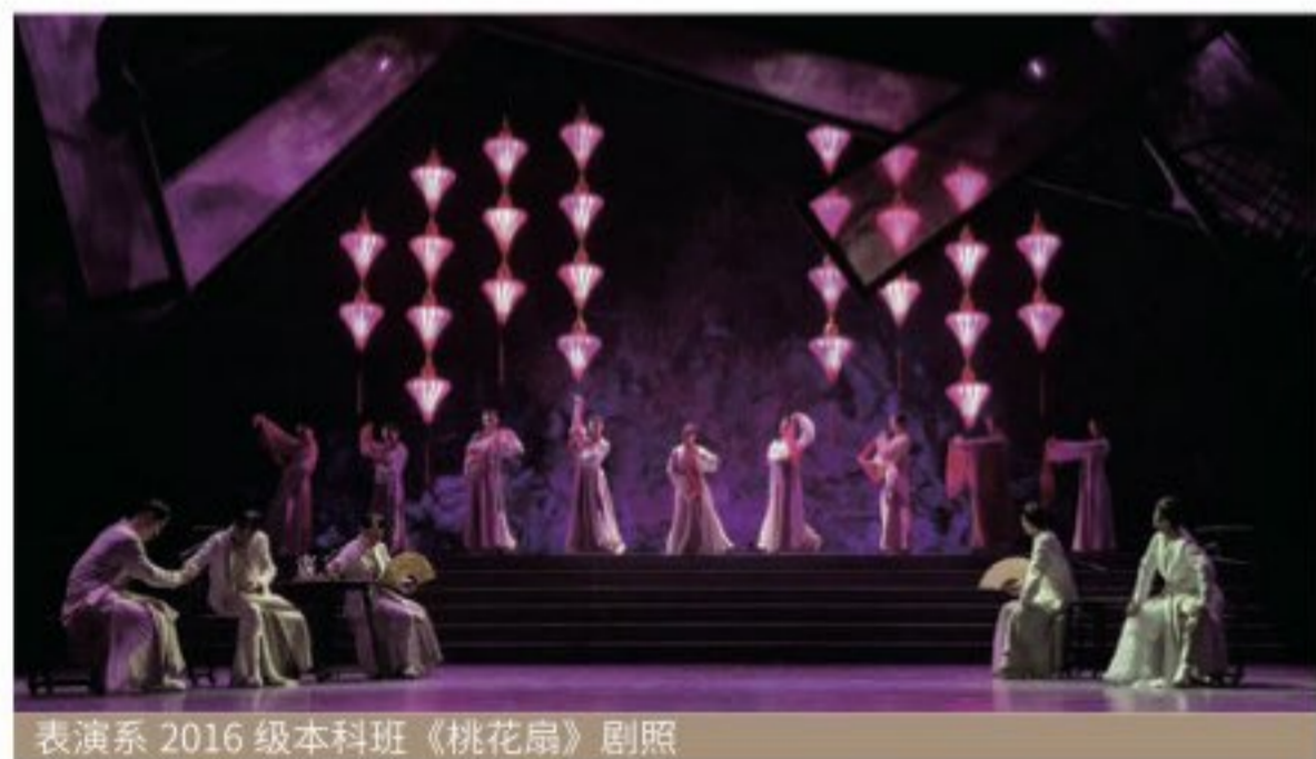
表演系 2016 级本科班《桃花扇》剧照

表演系设有表演专业(话剧影视表演方向)、曲艺专业(曲艺相声创作表演方向),培养系统掌握表演艺术创作方法、基本技能、基本理论和创作技巧,从事话剧影视表演创作和曲艺相声创作表演实践的专门人才。