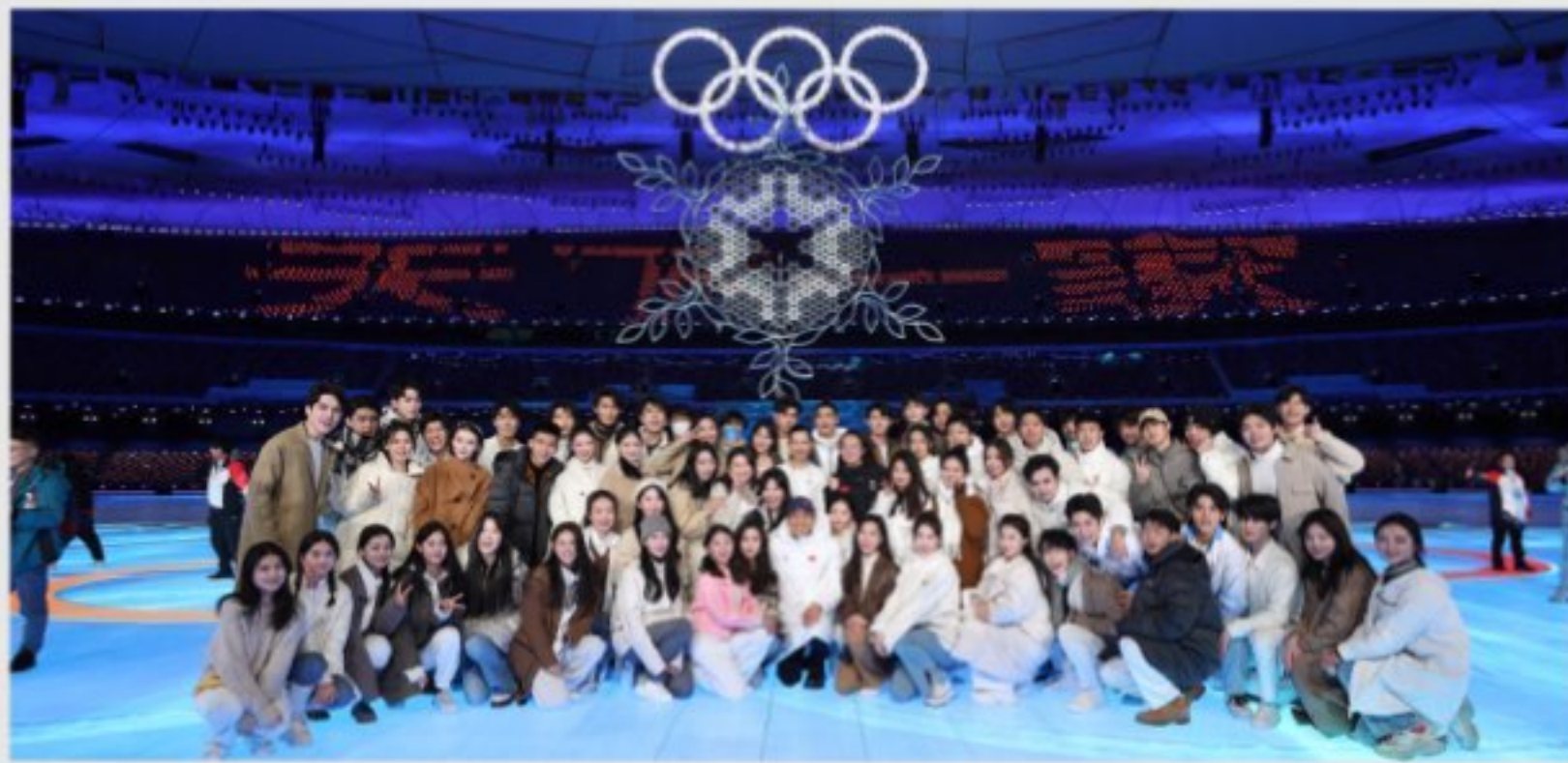
北京冬奥会闭幕演出后与张艺谋导演合影