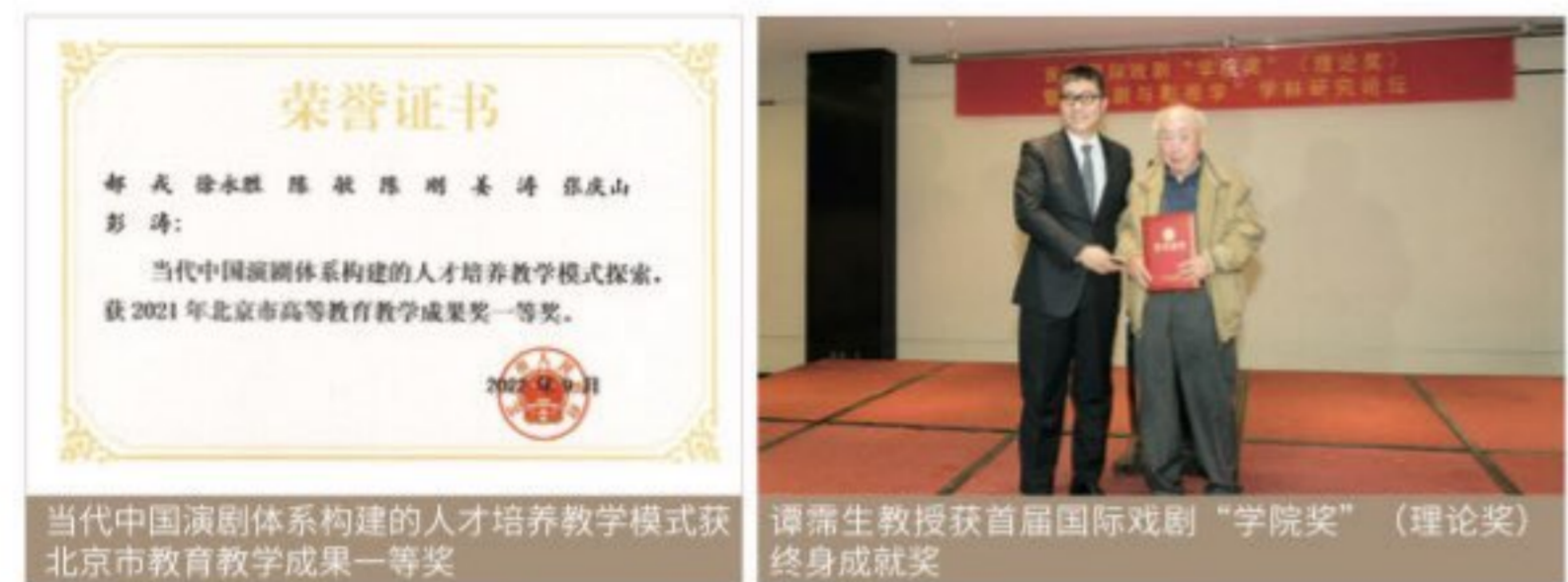
当代中国演剧体系构建的人才培养教学模式获北京市教育教学成果一等奖

戏剧学系培养兼备戏剧艺术基础理论及剧目演出鉴赏力，具有基础理论教学、理论研究及戏剧批评能力的专业人才。主要研究方向是“戏剧理论”，注重整体性和全面性；研究对象包容戏剧文学、表演、导演以及舞台演出的有关元素。