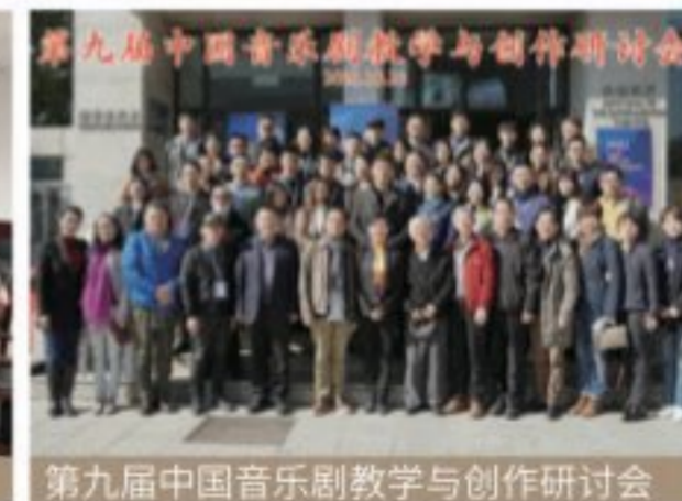
第九届中国音乐剧教学与创作研讨会