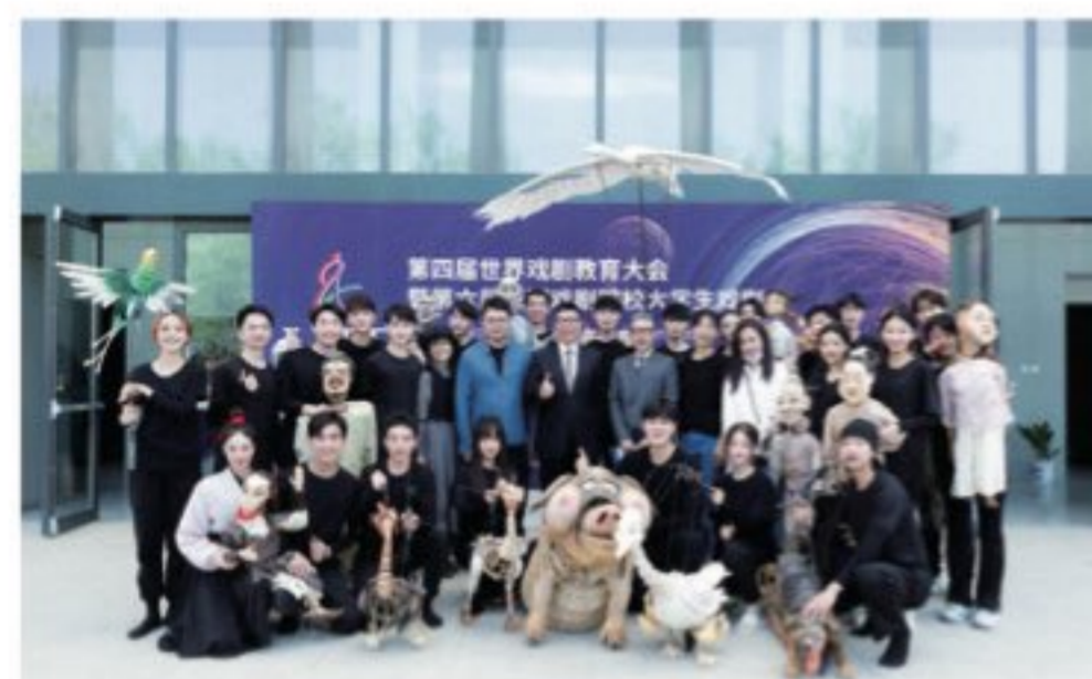
2021年偶剧系参加第六届亚洲戏剧院校大学生戏剧节剧目展演

偶剧系设有表演专业（偶剧表演与设计方向），培养德才兼备，能够掌握偶剧表演与造型设计的专业技能及理论，具备偶剧表演与设计实践创作能力的优质专业型人才。