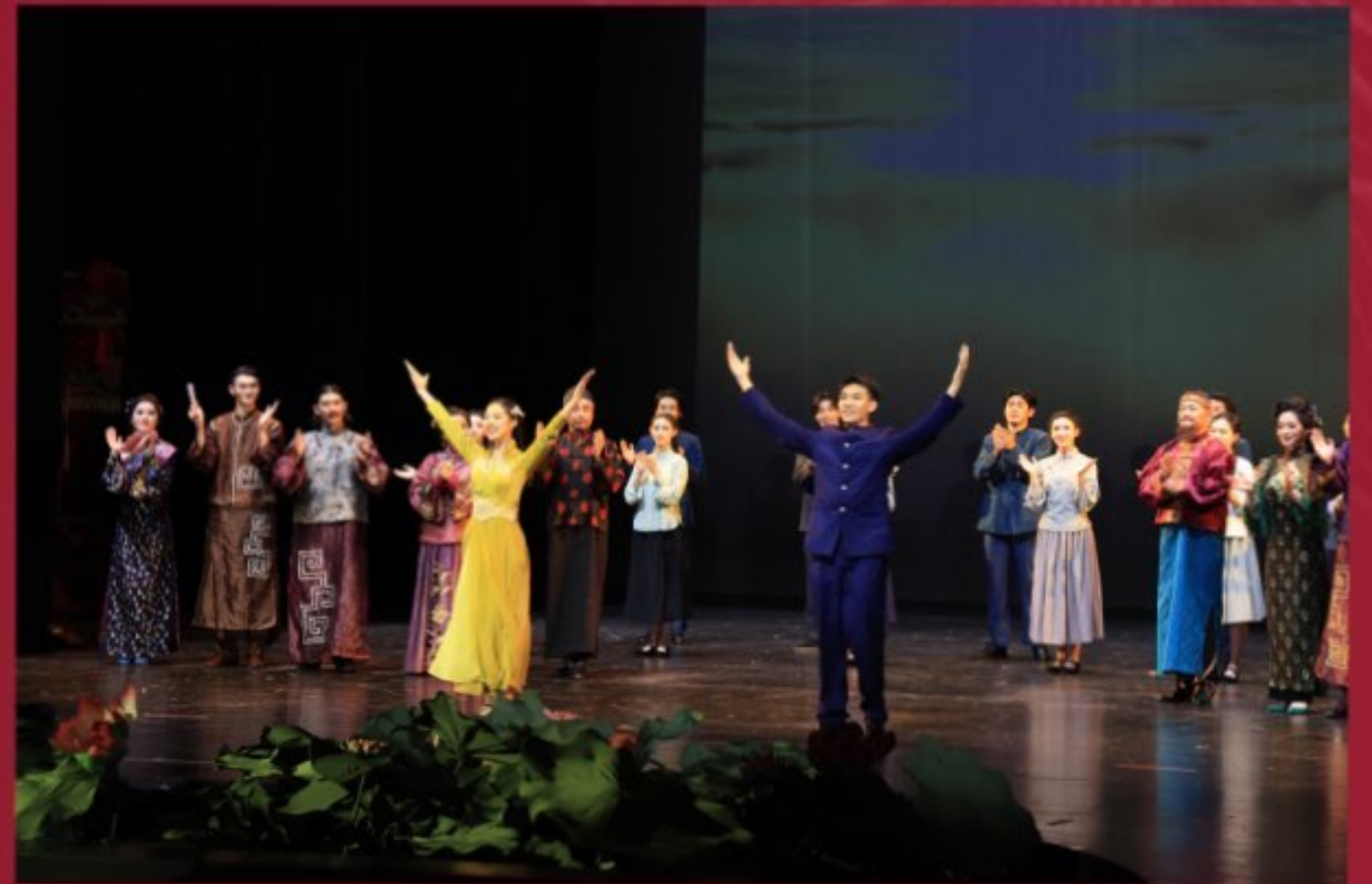
参加原创音乐剧《家》全国巡演