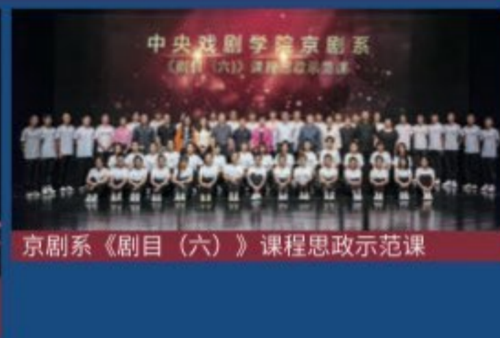
京剧系《剧目（六）》课程思政示范课