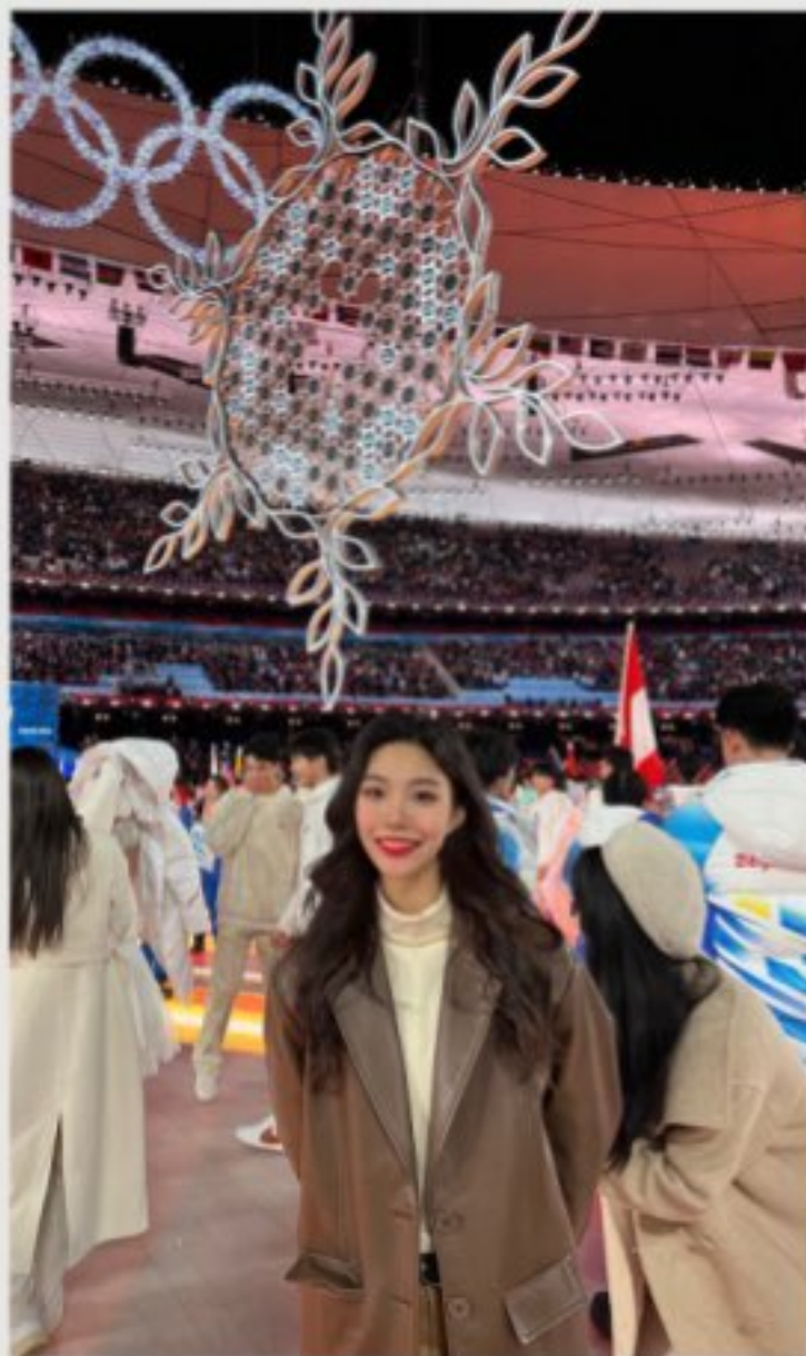
参加北京冬奥会闭幕演出