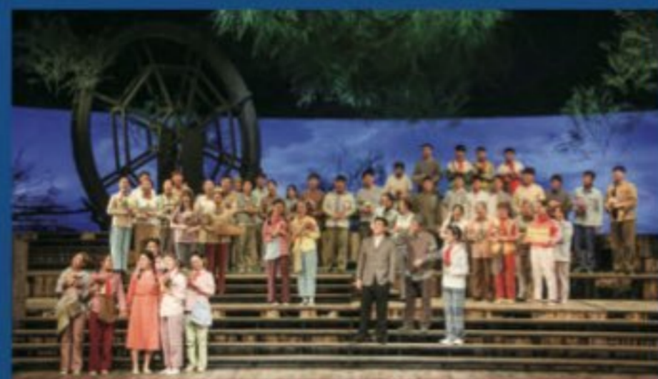
2014 级歌剧表演班毕业大戏《山村女教师》

歌剧系设有表演专业（歌剧表演方向），培养具有全面的文化艺术素养，掌握扎实的理论知识基础、基本技能，较好的艺术鉴赏能力和实践能力，能够运用歌剧表演艺术创作规律和技巧进行歌剧创作实践的专业人才。