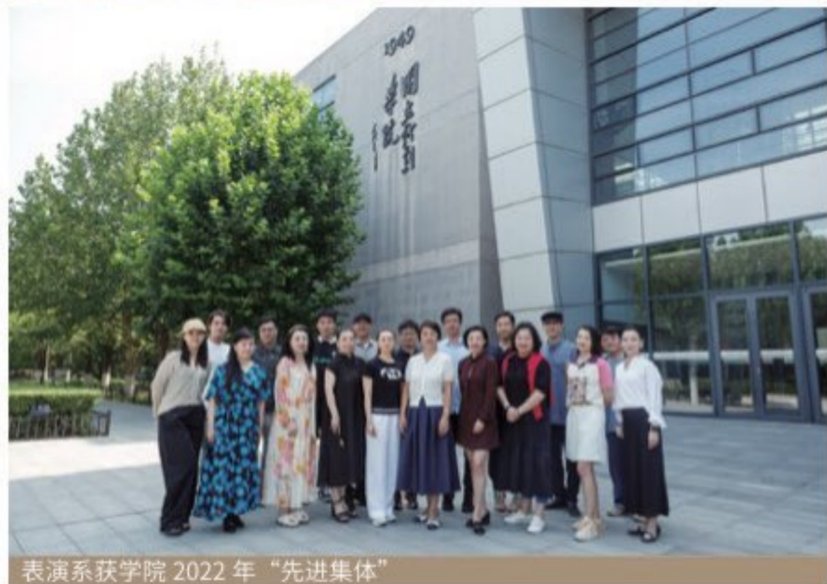
表演系获学院 2022 年“先进集体”