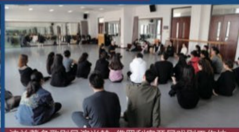
波兰著名歌剧导演米赫·佛罗利安开展戏剧工作坊