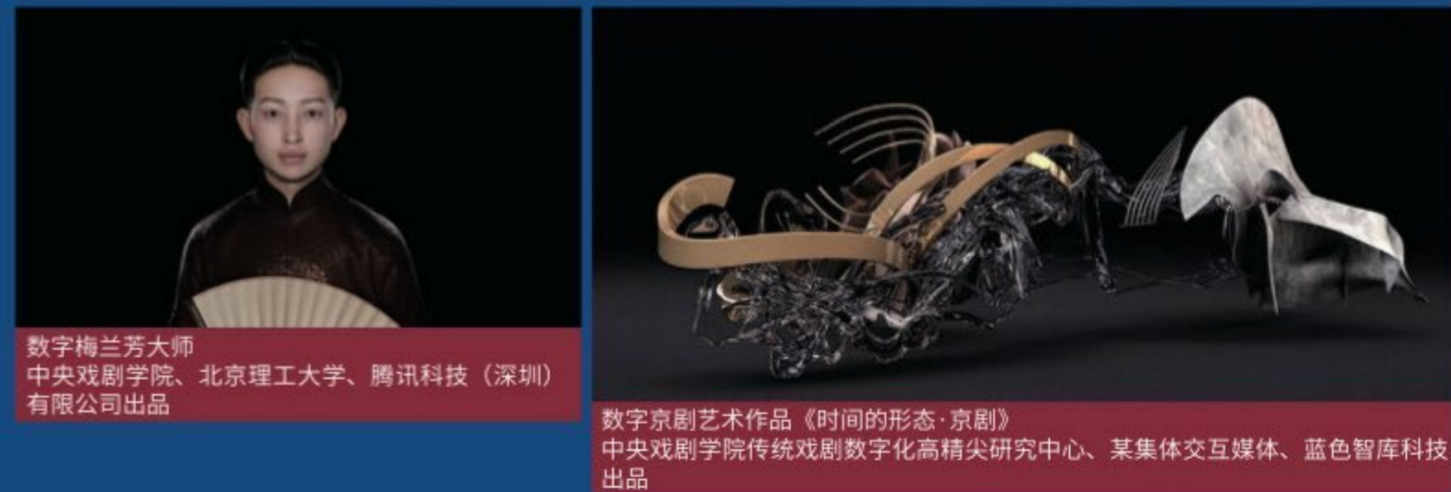
数字梅兰芳大师 中央戏剧学院、北京理工大学、腾讯科技（深圳）有限公司出品