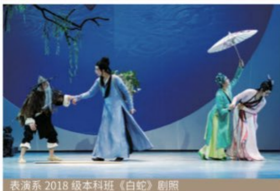
表演系 2018 级本科班《白蛇》剧照