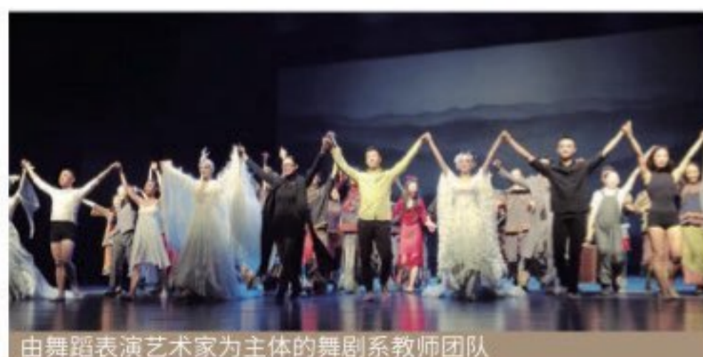
由舞蹈表演艺术家为主体的舞剧系教师团队

舞剧系设有表演专业（舞剧表演方向），培养德才兼备、系统掌握舞剧表演体系技能、人物创作方法和塑造能力以及具备舞剧理论知识修养、舞剧编创基础知识的舞剧表演专业精英人才。