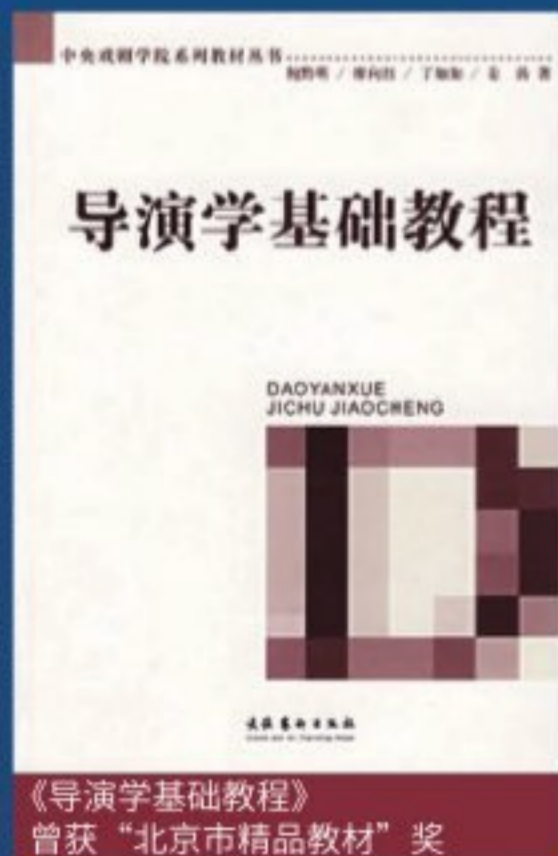
《导演学基础教程》 曾获“北京市精品教材”奖