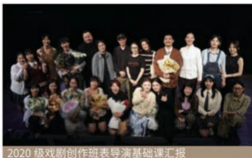
2020 级戏剧创作班导演基础课汇报

戏剧文学系设有戏剧影视文学专业（戏剧创作、电视剧创作方向）、戏剧学专业（戏剧史论与批评、戏剧策划与应用方向），培养戏剧影视文学创作、中外戏剧史论研究、戏剧评论以及戏剧艺术教学和科研的专业人才。