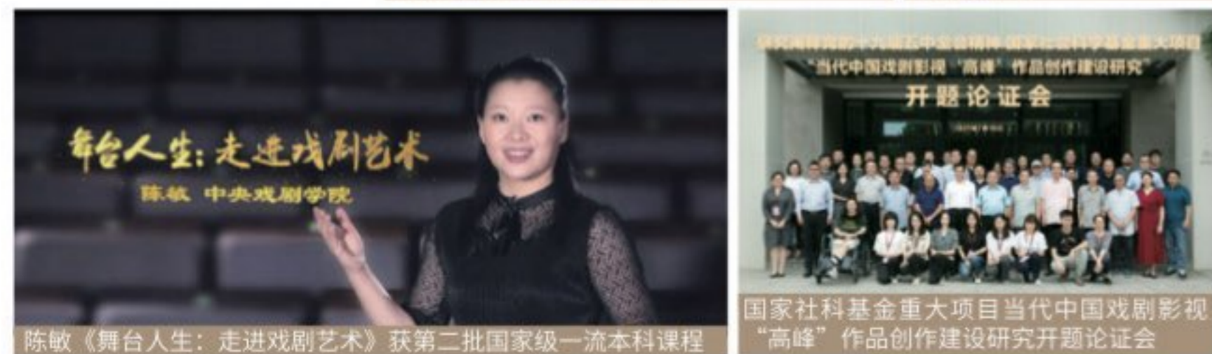
陈敏《舞台人生：走进戏剧艺术》获第二批国家级一流本科课程