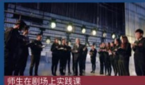
师生在剧场上实践课