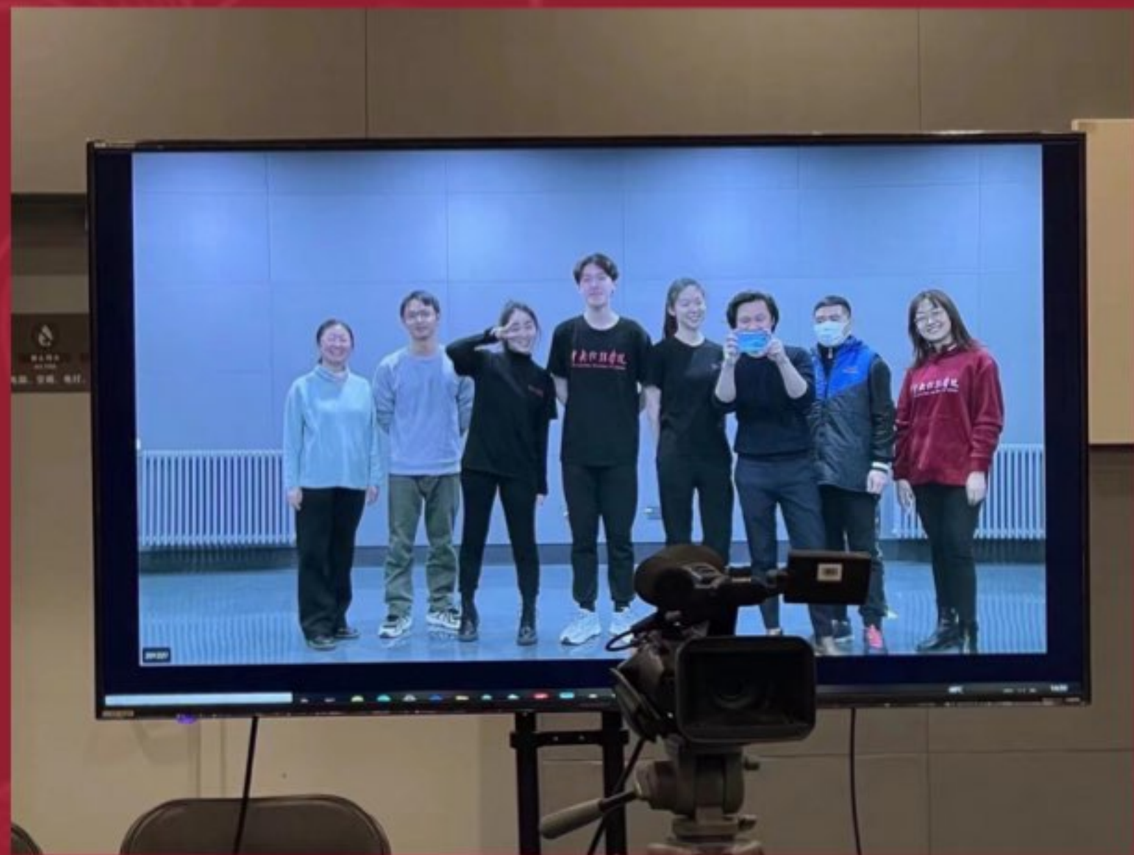
2020年中华文化知识大赛