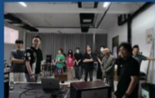
舞台美术系教学检查