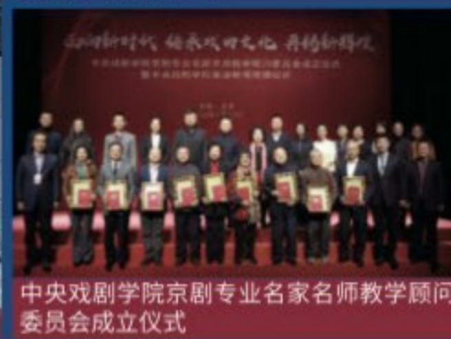
中央戏剧学院京剧专业名家名师教学顾问委员会成立仪式