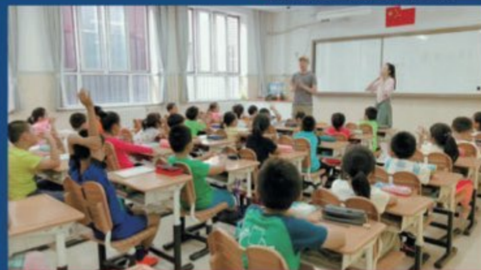
戏剧教育系特色教学课程