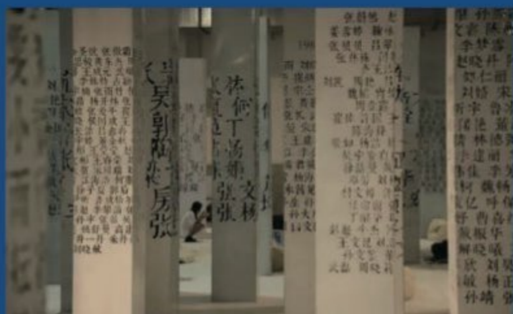
第四届中国舞台美术展-院校成果展

舞台美术系设有戏剧影视美术设计专业(舞台设计、舞台灯光设计、舞台服装设计、舞台化妆设计、舞台造型体现、舞台技术、演艺影像设计),录音艺术(演艺声音设计)共八个专业方向。主要培养具有深厚人文素养和扎实的专业技能的戏剧、影视美术创作专门人才。