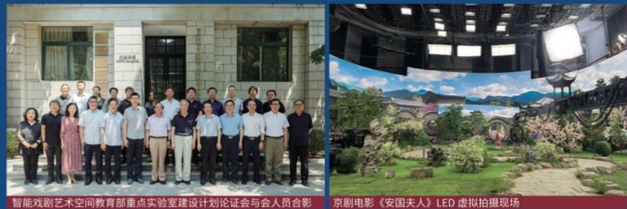
智能戏剧艺术空间教育部重点实验室建设计划论证会与参会人员合影

数字戏剧系作为学院面向国家文化数字化发展战略需要而新成立的教学科研单位，立足于戏剧本体，注重学科交叉，围绕数字时代信息科技、智能科技等前沿科学技术在戏剧艺术领域的应用，培养具备文化科技和戏剧影视相融通能力和服务国家文化发展战略视野的跨学科复合型人才。现设传统戏剧数字化、戏剧人工智能、数字文化制度博士研究方向，戏剧数字化硕士研究方向。数字戏剧系是学院智能戏剧艺术空间教育部重点实验室建设重要成果之一。