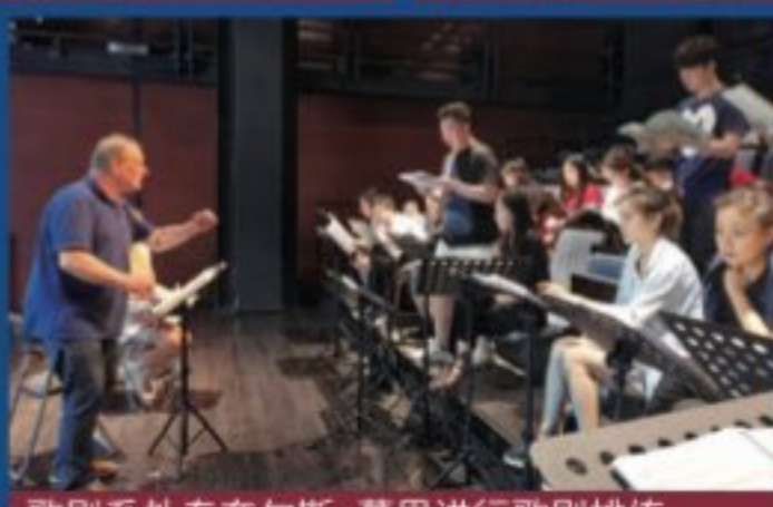
歌剧系外专奈尔斯·慕思进行歌剧排练